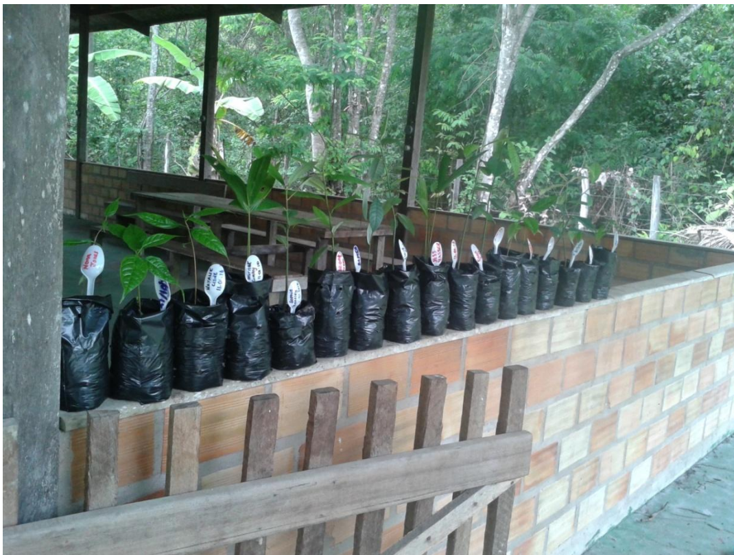
Fotografia 1 - Mudanças para o replantio

Em 2013 a empresa de cosmético contratou a UFSCAR – Universidade de São Carlos (SP) e outros parceiros para realizar um projeto relacionado à virola ucuúba. O Projeto virola, também chamado de Projeto ucuúba ou de conservação tem a missão de capacitar jovens para melhorar o conhecimento sobre a espécie, aprender a fazer o manejo e o replantio através de mudas. (Fotografia 1 e 2).