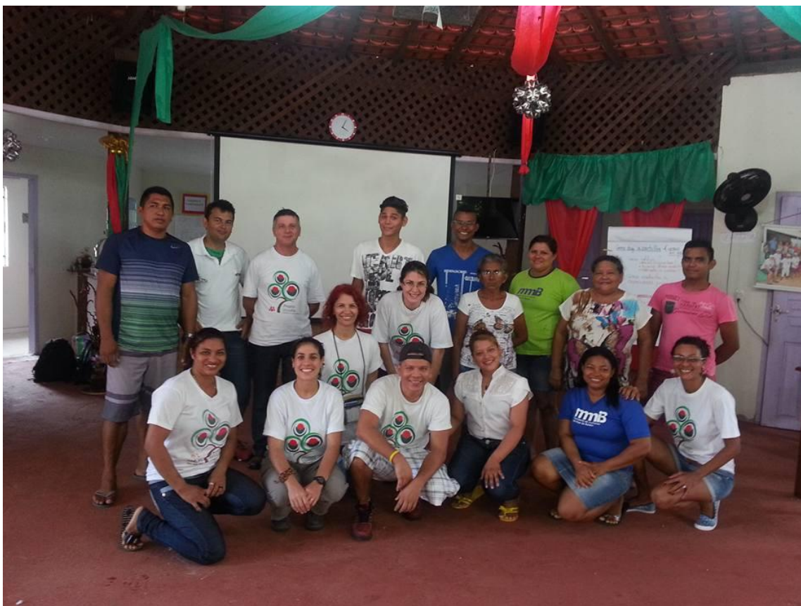
Fotografia 2 – Projeto Virola (ou ucuúba): Capacitação